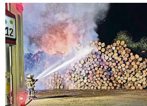
Ein großer Holzstapel stand in der Nacht zu Mittwoch in Flammen.

Der Sachschaden wird derzeit auf etwa 25.000 Euro geschätzt. Die Suhler Kriminalpolizei ermittelt zur Brandursache.